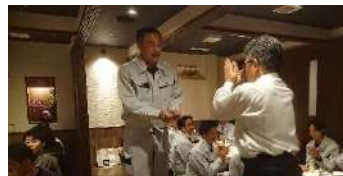
社内表彰式・慰労会 4/27