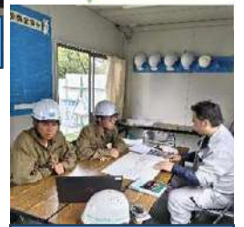
2023 インターソップ 8/23