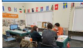
LIXIL リフォームショップ 大相談会 11/11