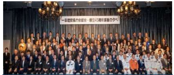
45周年記念式典・協力会総会 2/27