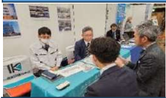
ビジネスマッチング出展 11/10