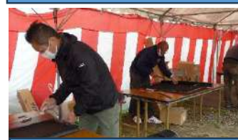
網戸貼替キャンペーン 3/25