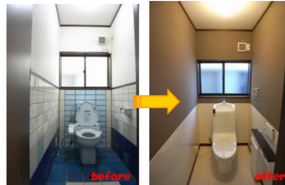
トイレは排水口からの臭いが気になったので塞いでサニタリーフロアを貼りました。また、壁や床は寒さを感じる材質と色使いから、暖色系で一新しました。