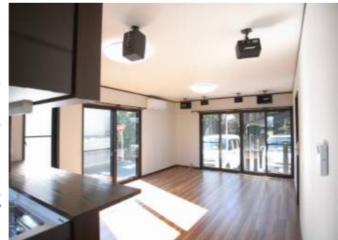
天井にサウンドスピーカーを取り付けたリビングは、ご趣味の映画・音楽鑑賞を楽しめるシアタールームも兼ねています。