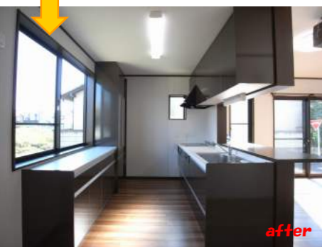
キッチンがL型からI型に変更 吊戸棚・食器収納棚を新設することで 収納スペースが充実しました。