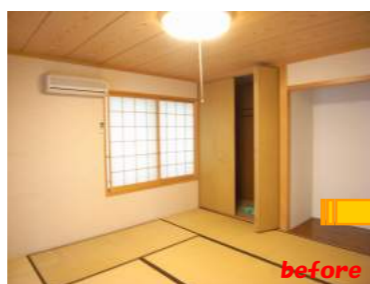
和室から洋室に改装 使い勝手が広がります。